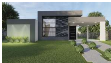
Estâncias da Mata