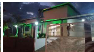
Aldeia da Jaguará