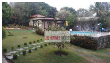
Villa Monte Verde