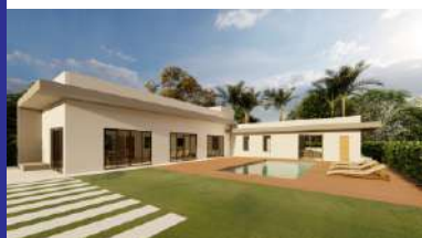
Vale do Luar